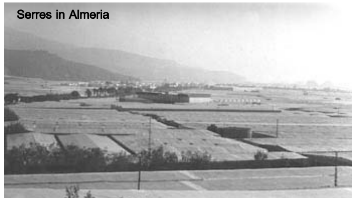
Serres in Almería

zich al een bijzonder belangrijke troef. In de westerse landen laten een blanke huidskleur of een zo christelijk mogelijke cultuur toe dit soort praktijken daarenboven onzichtbaar te maken. Daardoor zagen we hoe na de racistische rellen tegen de Marokkanen in Spanje werkkrachten werden aangeworven uit de voormalige sovietrepublieken. In 2002 waren in de regio Huelva in Andalusië, gekend voor zijn arbeiteerteelt, 55.000 seizoensarbeiders tewerkgesteld, waarvan 10.000 vreemdelingen. De Spaanse regering kende een quota toe van 7.000 vreemdelingen: 5.800 Polen, 1.000 Roemenen, 418 Marokkanen, 150 Colombianen... Meer dan 6.000 Marokkanen die er jarenlang werkten, verloren hun job. ■